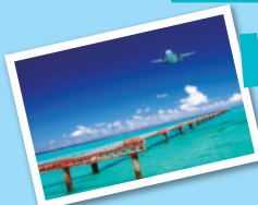
タコ公園下ビーチ