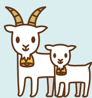
宮古の方言でピンザ