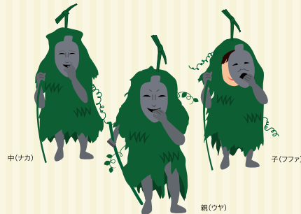
宮古島のパーントゥ ※掲載の画像は全てイメージです。

住 宮古島市伊良部字前里添1 ☎ 080-6485-0853 営 11:00~15:00 ※LOは14:30 休 火曜日 P有 ¥450円 MAPCODE® 721 310 558*03