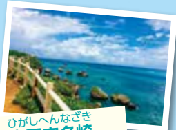
ひがしへんなざき 東平安名崎

3年連続で日本のベストビーチトップ10に選ばれた砂山ビーチ。ヤシガニや蝶などにも出会えますよ!